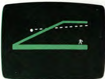
Pelota demasiado larga

para agarrar la pelota, como se indicó en (ii). Si el outfielder logra atrapar la pelota, el bateador queda OUT. Si es una pelota muy larga y el outfielder no puede hacer nada, el bateador marca automáticamente un jonrón, y todos los jugadores del equipo de ofensiva que estén en las bases pueden correr hasta la base "home".